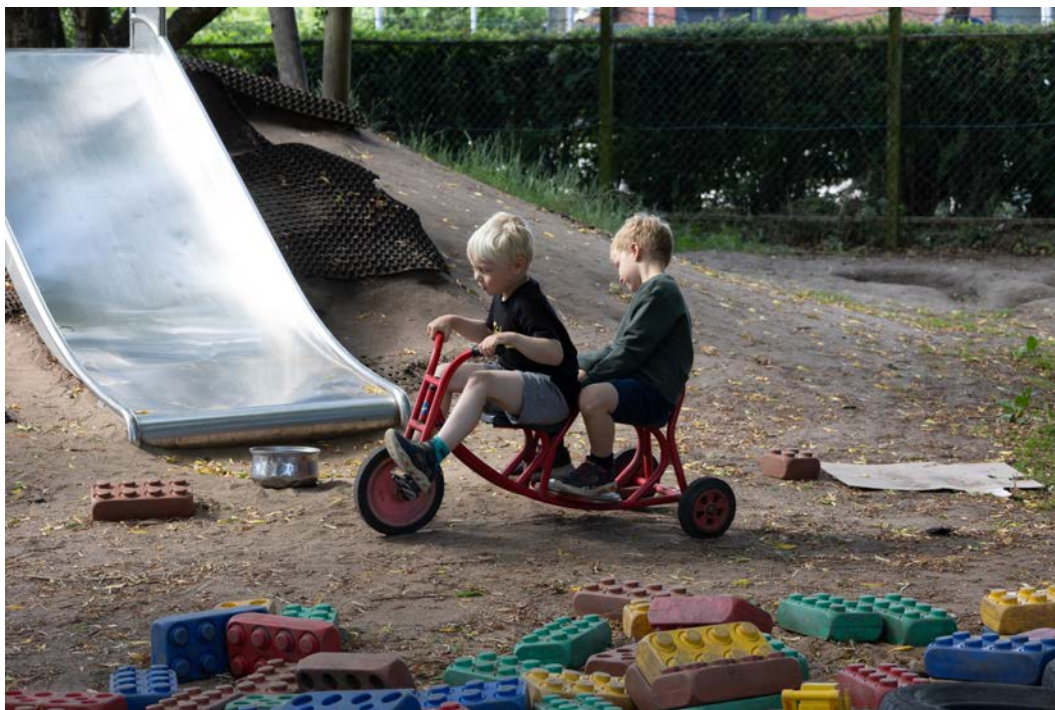
Legepladsen skal renoveres, men her og nu skal der leges uanset legepladsens tilstand.

Det er tidligere nævnt, at vi har et udviklingsarbejde omkring barnets udviklingsplan, hvor vi ser barnets fire dimensioner. Her er det betydningsfuldt, at samarbejdet med forældrene omkring et sammenhængende børnesyn er det bærende i hele forløbet fra 2,11 år-13 år.