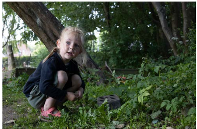
Naturen er en herlig legeplads. Blade, grene og frugter kan bruges opfindsomt.