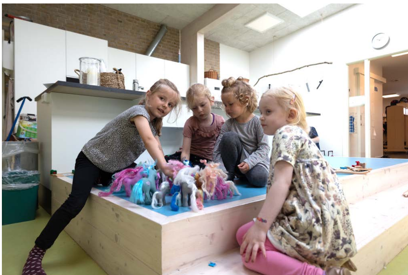
Prinsessehesten står i midten. Fri leg i fællesrummet.

Vi har et stort fokus på børnenes leg og de voksnes rolle i børns leg. Formålet er, at understøtte børnenes kompetencer, ved at de pædagogiske medarbejdere aktivt og på et fælles grundlag, engagerer sig i og understøtter børnenes leg. Vi reflekterer over eget engagement i børnenes leg og igennem faglig sparring.