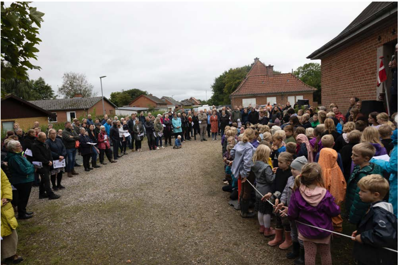
Børn og voksne i alle aldre deltager i åbning af Billesporet, 2021.