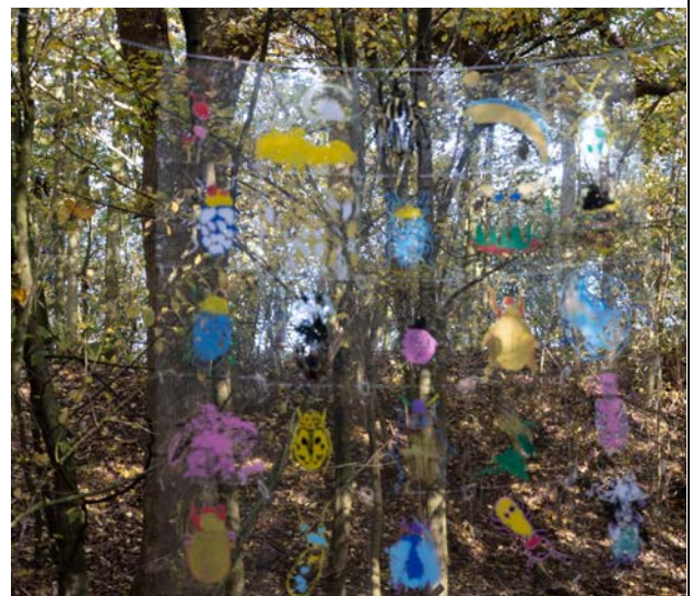
Billesporet har været med til at skabe nye "steder" i skoven ved stationen.