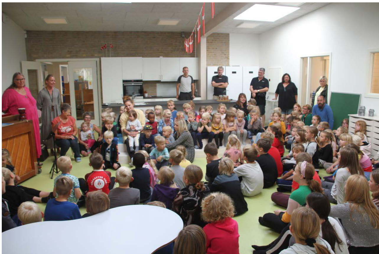
En stor dag. Den nye børnehave står færdig og skal indvies. Børn fra børnehaven og skole nyder at finde sig til rette i de nye rammer.

Svaret var “ja det er I i hvert fald” og en anden dreng “ved du hvad, jeg øver mig også, jeg er faktisk blevet bedre til at trøste andre børn ”