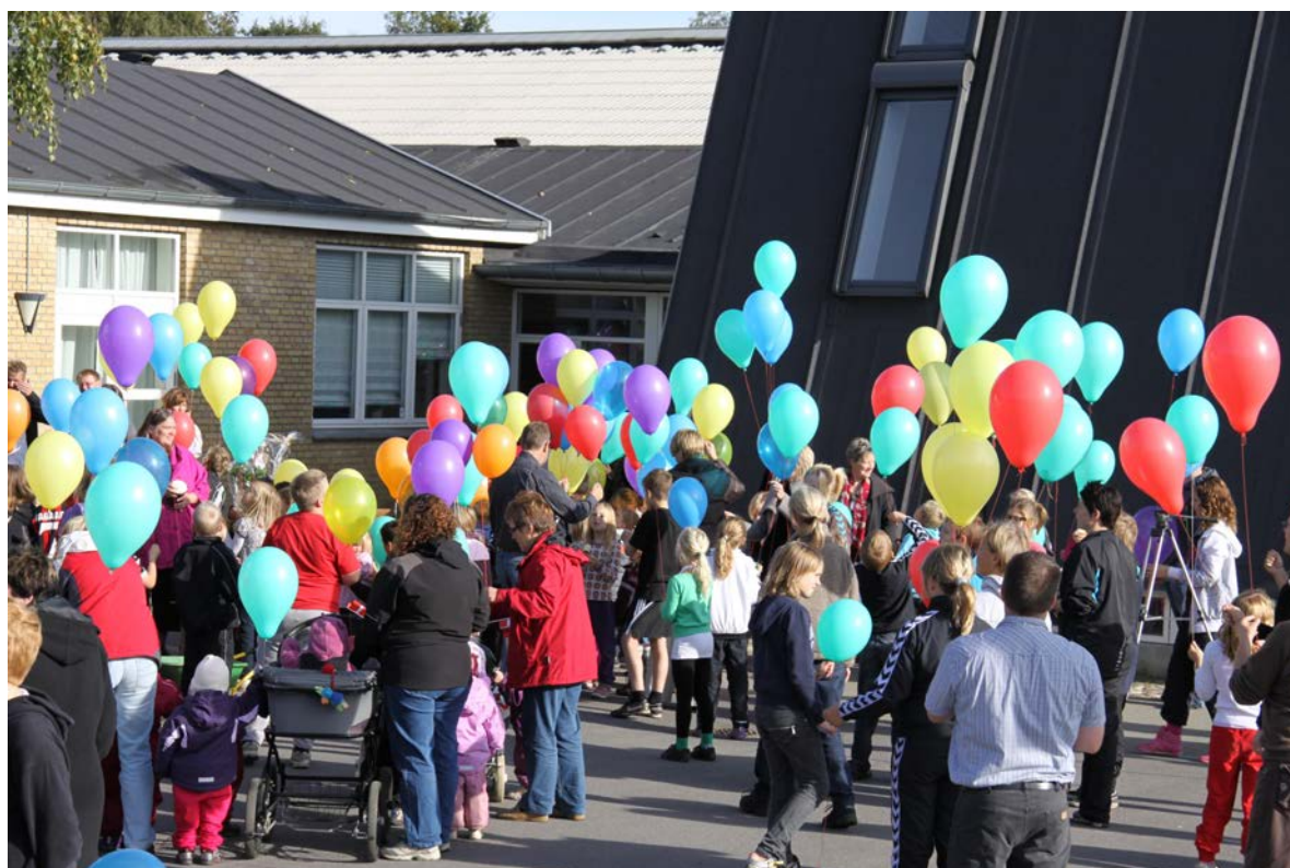
Corona har begrænset muligheden for større fællesarrangementer. Billedet er fra Hem Skoles 60-års dag, hvor børn i alle aldre holdt fest sammen med deres voksne.